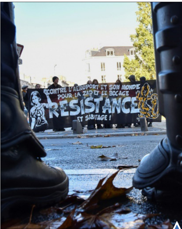
تظاهرات در غرب فرانسه

چوی سون سیل، دوست نزدیک رئیس جمهور کره جنوبی که به اتهام فساد سیاسی دستگیر شده