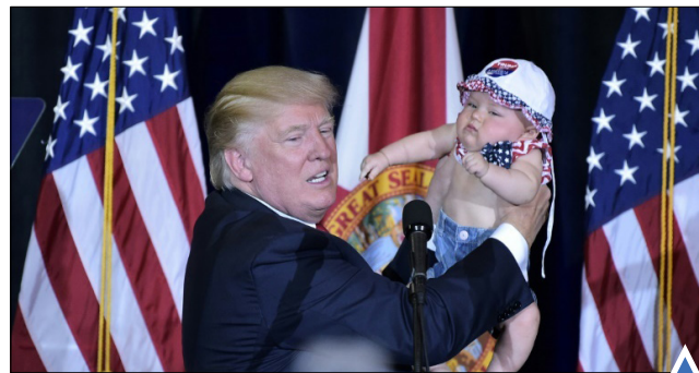
کمیته انتخاباتی ترامپ در تمپا