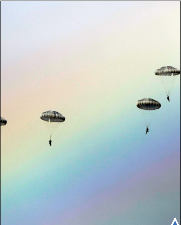
تمرین نظامی روسیه، بلاروس و صربستان