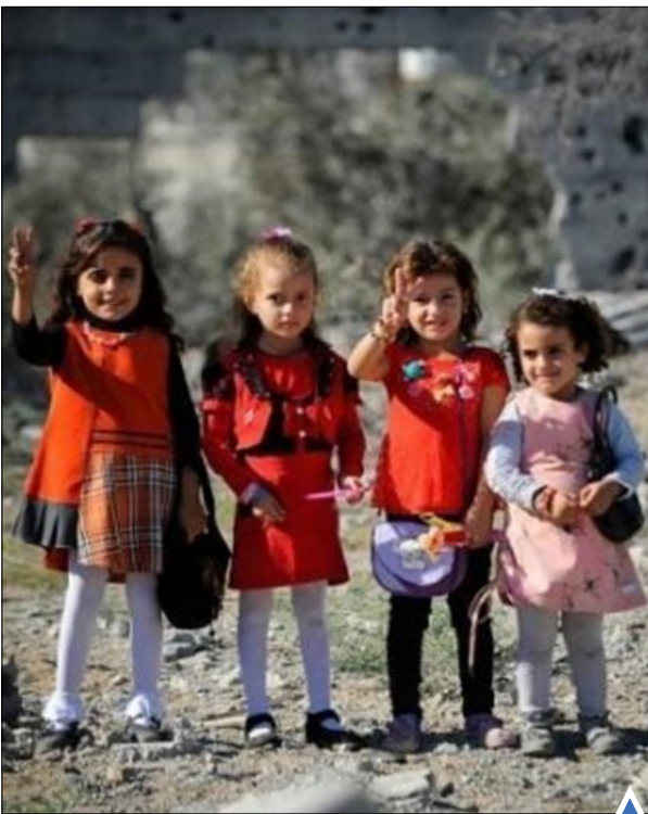
کوکان بی سرپناه فلسطینی در بیت حانون