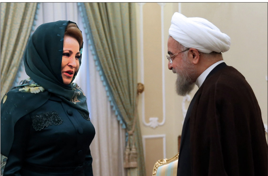
«والنتینا ماتوینیکو» رئیس شورای فدراسیون روسیه روز دوشنبه با حجت الاسلام والمسلمین حسن روحانی رئیس جمهوری اسلامی ایران دیدار و گفت و گو کرد