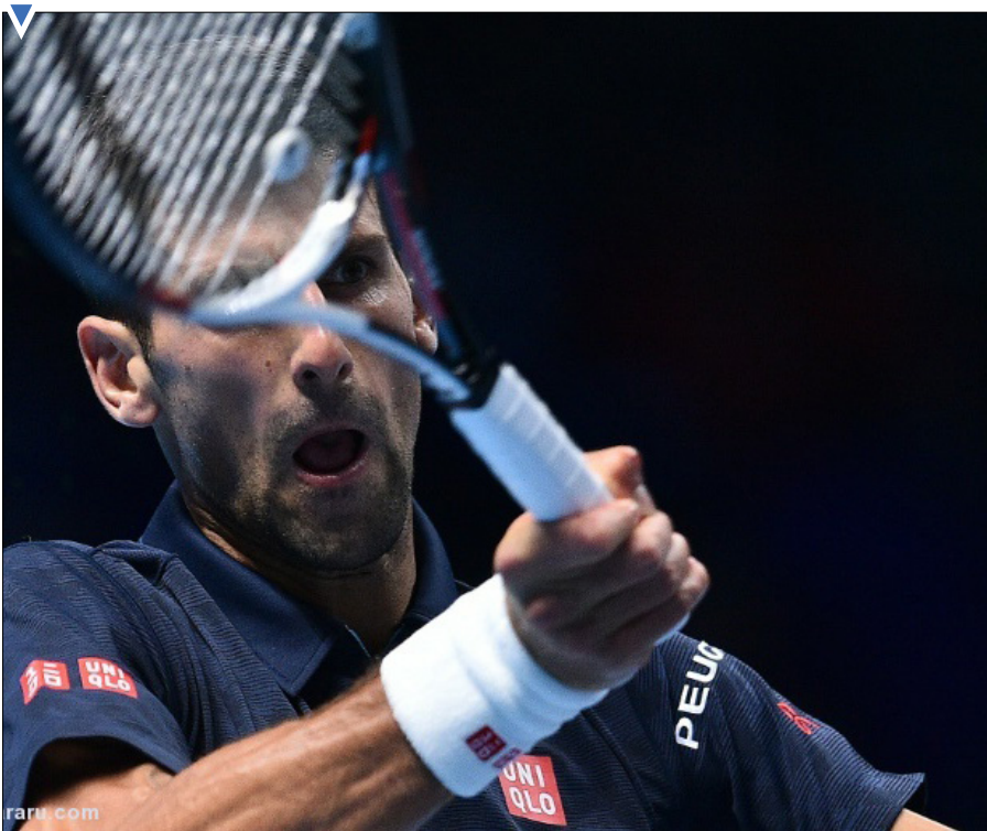
پیروزی جوکوویچ در مسابقات تنیس لندن