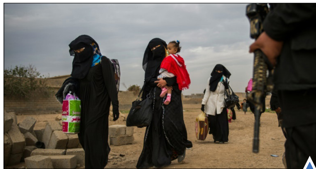
تخلیه بمباران شده