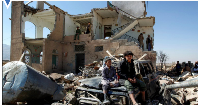
خانه بیماران شده در نزدیکی صنعا