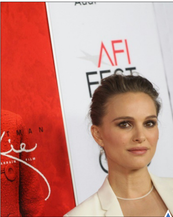
ناتالی پورتمن در مراسم فیلم "جکی" در هالیوود