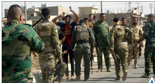
دستگیری افراد مشکوک توسط نیروهای امنیتی عراق در محله کرکوک

استفاده از ماسک ضد گاز در عملیات بازپس‌گیری موصل