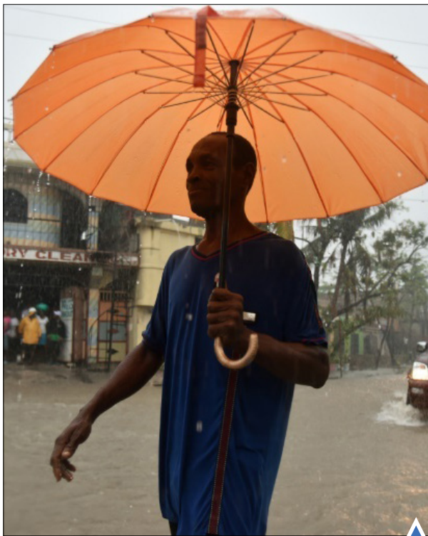
بارش سنگین باران در هائیتی