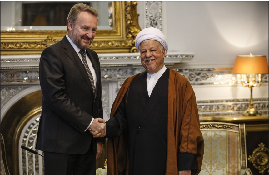
دیدار رییس شورای ریاست جمهوری بوسنی و هرزگوین با رییس مجمع تشخیص مصلحت نظام