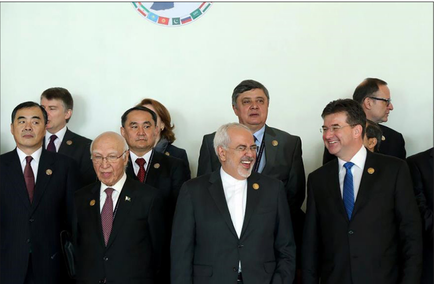
اجلاس «قلب آسیا»