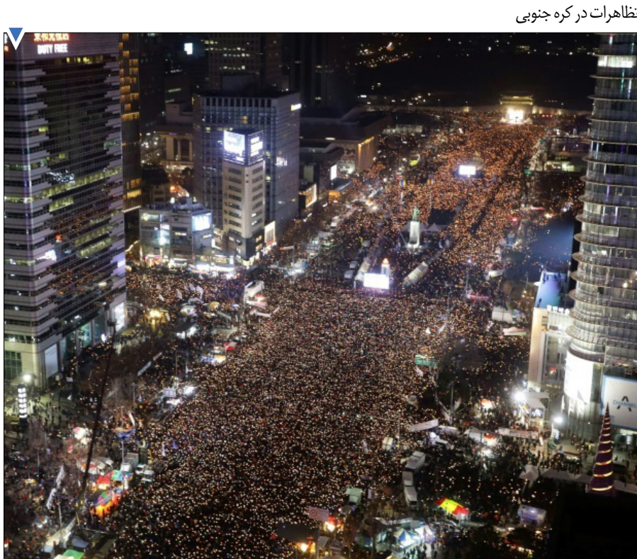
تظاهرات در کره جنوبی