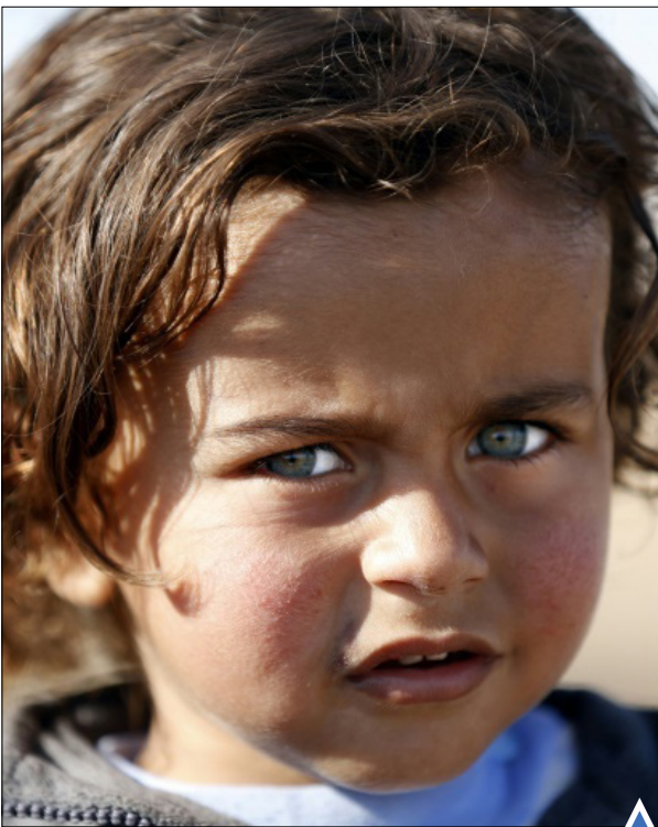
کودک آواره عراقی