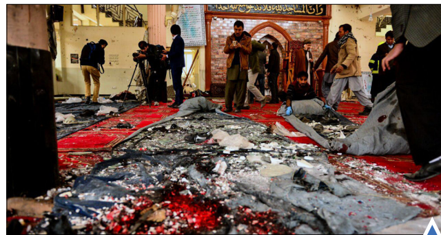
حمله انتحاری به مسجد باقر العلوم