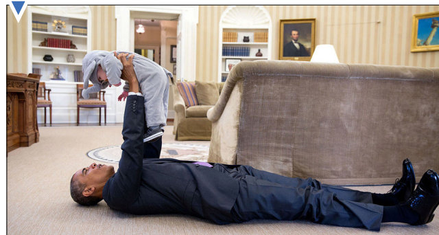
رئیس جمهور اوپاما در روزهای آخر ریاست جمهوری