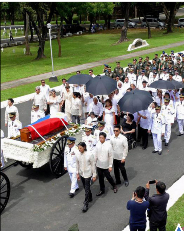
خاکسپاری دیکتاتور سابق فیلیپین