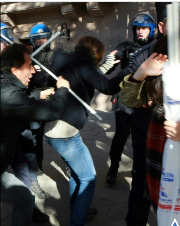
برخورد با تظاهرکنندگان در آنکارا